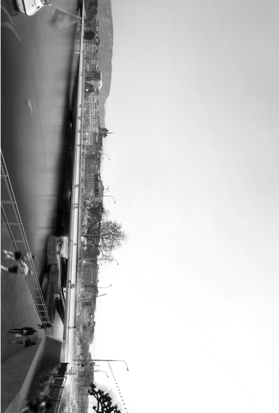
image de la future passerelle de Mont-Blanc © Pierre-Alain Dupraz Architectes