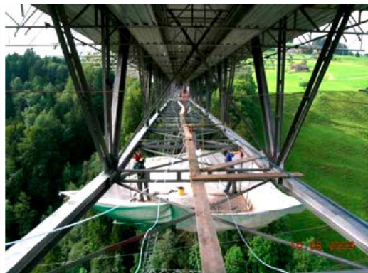
Haggenbrücke bei St. Gallen