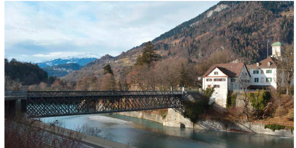
Rheinbrücke Reichenau GR

Stahlbrücken machen einen Bruchteil der Kunstbauten der Verkehrsinfrastruktur aus, doch gehören sie ebenso zur Baukultur wie die Spannbetonbrücken des Nationalstrassennetzes oder die steinernen Brücken der Albulabahn. Sie entstanden oft um die 19./20. Jahrhundertwende und sind nun Gegenstand tiefgreifender Instandsetzungen, um ihre Funktion auf erhöhte Bedürfnisse anzupassen. Wie dies gelingt, zeigen fünf realisierte Umbauten und eine Semesterarbeit. Neben der üblichen Korrosionsschutz-erneuerung sind es vielfältige Bauaufgaben, die anspruchsvolle und manchmal einzigartige technische Umsetzungen hervorrufen. Im Sinne eines Erfahrungsaustauschs erläutern die Projektverfasser die von ihnen entwickelten Lösungen.