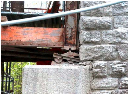
Vorderrheinbrücke Valendas GR