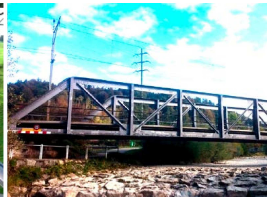
Eisenbahnbrücke Turbenthal-Wila ZH