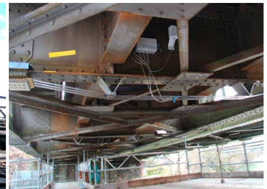
Birsbrücke bei Münchenstein BL